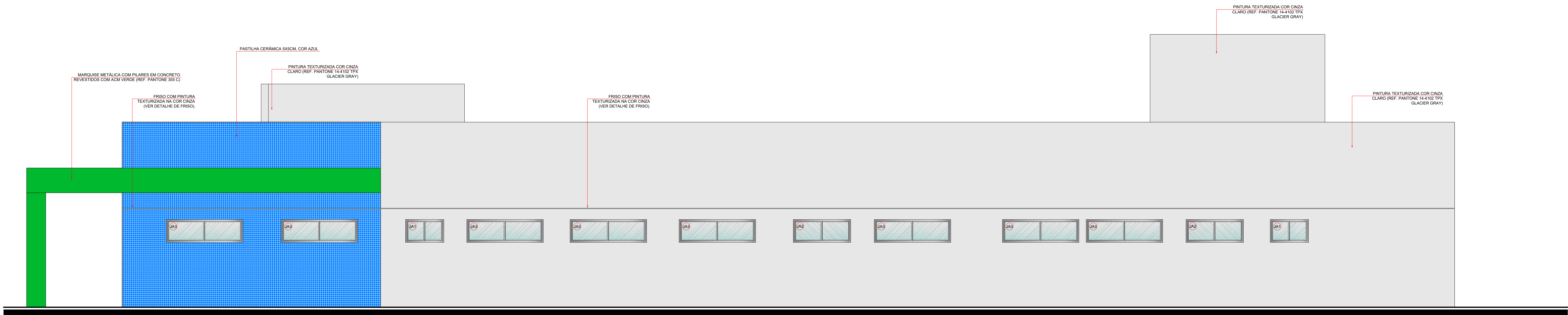
ELEVÇÃO 03 ESCALA 1:50